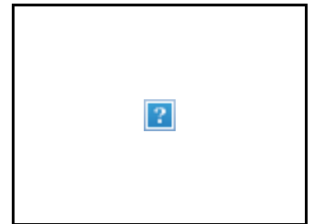
Aan de slag in 'corporate America'

Film Muziek Politiek Literatuur Wetenschap Human Interest